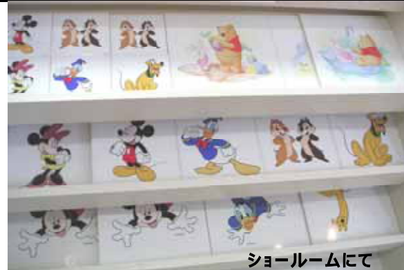
ショールームにて